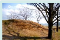
▲園庭内にあるアロハ山

広い園庭にある通称「アロハ山」という特徴的なあそび場を使って、平面の園庭にはないあそびや運動を展開しています。このあそび場を使った保育者の環境構成や言葉かけなどにより子どもたちの心身の成長を促しています。山に登る姿（月齢や年齢によって這う→歩く→走る）により成長が感じられます。また、ピアノの音に合わせて園児が自ら体を動かしていくリズム運動（さくらさくらんぼリズム）では、ハイハイ、両足ジャンプなどの発達面をみながら取り組んでいます。そのほかには5歳児になると子どもたちが自分で布ひもを三つ編みで編むところから始める「なわとび」にも取り組んでいます。