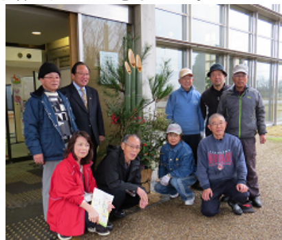
福祉人材研修センター正面玄関

《 お問合せ先：県立福祉人材研修センター TEL 0857-59-6330 FAX 0857-59-6360 》