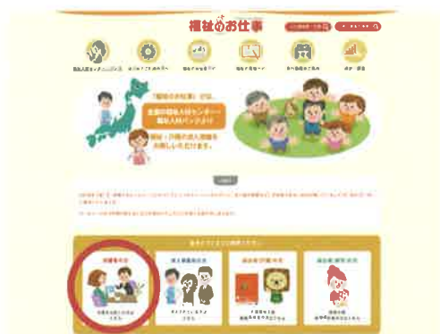
「福祉のお仕事」トップページ