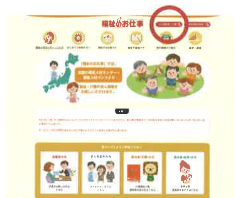
お仕事検索・応募ボタン

条件にあった求人票の一覧が表示されるので、気になった求人があれば 詳細を見る ボタンを押します。