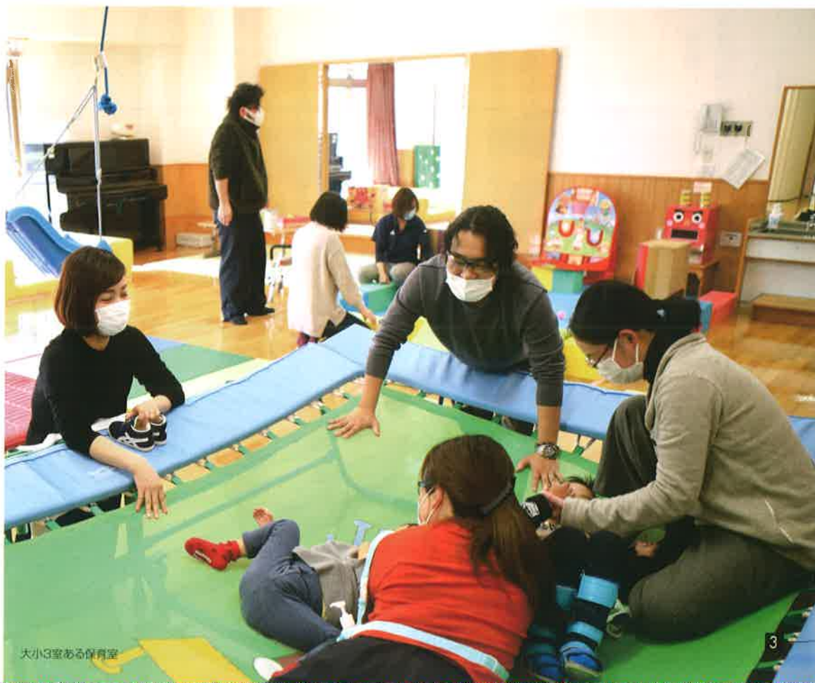
大小3室ある保育室

発達促進を目的とした、保護者向 けに行う「ペアレント・トレーニング」(ペ アトレ)プログラム)もあります。幅 広い障がいを持つ子どもにアレンジ して保護者に向けて実施し、より適 切な行動を促す上手な伝え方や、 良い行動の褒め方、環境調整の仕方