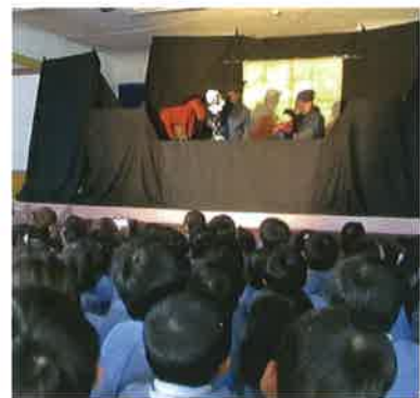
過去の公演の様子

障がいをと舞台をつくる人形劇団は全国的にもまれで、「障がいと社会の間に壁をつくってはいけない」という想いで、障がい者の背中を押すように社会参加に取り組んでいます。