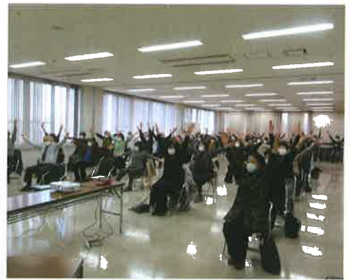
講師による演習の様子(啓成地区)

効果を証明されたことで、県は「とっとり方式認知症予防プログラム」を市町村と連携して県内へ広く普及することを目指し、指導者の養成や教材の整備などを行っています。