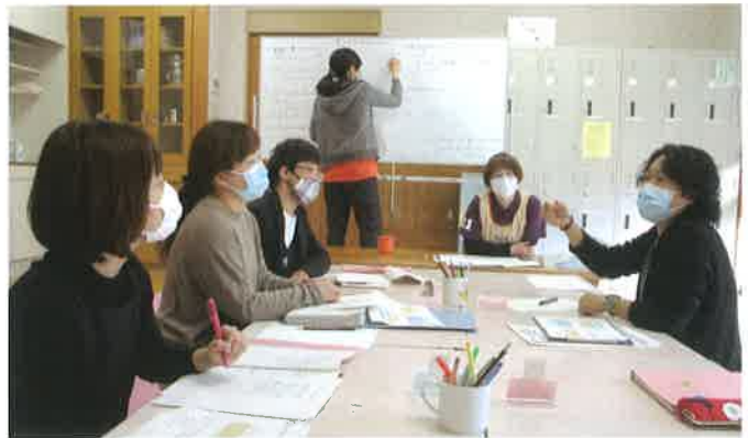
「サポートブック」づくりで深まる療育への理解

のスタッフなど、子どもがこれから新しく出会う支援者に向けて、保護者が子どもの特徴や支援のポイントをまとめた「サポートブック」の作成にも力を入れています。