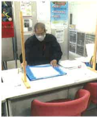
コーディネーターとして

「かぶりあ(copri-a)」は、カッブル(copple)から作られた言葉で男女が平等な立場で社会生活に共同で参画していく、また、末尾のiaは逆から読むとai(アイ)となり私自身として参画していくことを意味しているそうです。