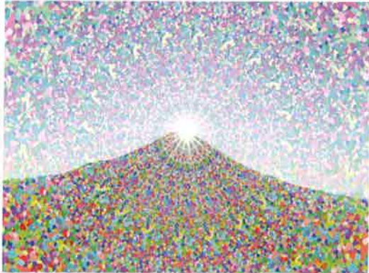
作品名:『富士山』 作者:太田垣 康二さん

NPO法人夢ハウス(障がい者就労継続支援B型事業所)では楽しみながらの社会参加をサポートしています。平成24年に鳥取県障がい者アート活動支援を受け、アート活動を開始しました。毎月2~3回、10~15名の利用者が参加して、絵画講師、イラスト講師の指導で作品を制作しました。現在、活動自粛中です。出展歴: あいサポート作品展(2016年~2020年) 百花斉放ドリームアート作品展(2015年~2019年)