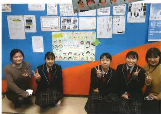
園児たちから贈られたメッセージを囲んで

これまで活動中に心配りをしながら必要なことをちゃんと気づけたことも活動がオフになった途端、その経験を活かすことができません、行動を起こすことのためにためらいがあった」と振り返り、「ボランティアを続けてきたことがとても大切に意義があることだった。あきらめず続けることでオン・オフを意識しないです。自然に行動に移せる様になってきたことが、私のなかで思っているボランティアのよさな気がする。これからも人が困っている時に助け合