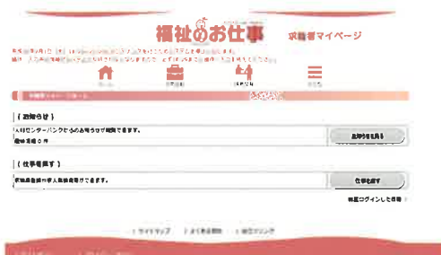
求職者マイページ